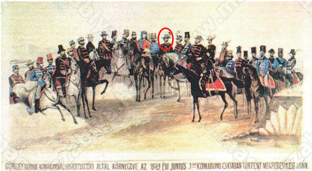
Görgey Artúr és táborkara a komáromi csata után 1848 július – Than Mór